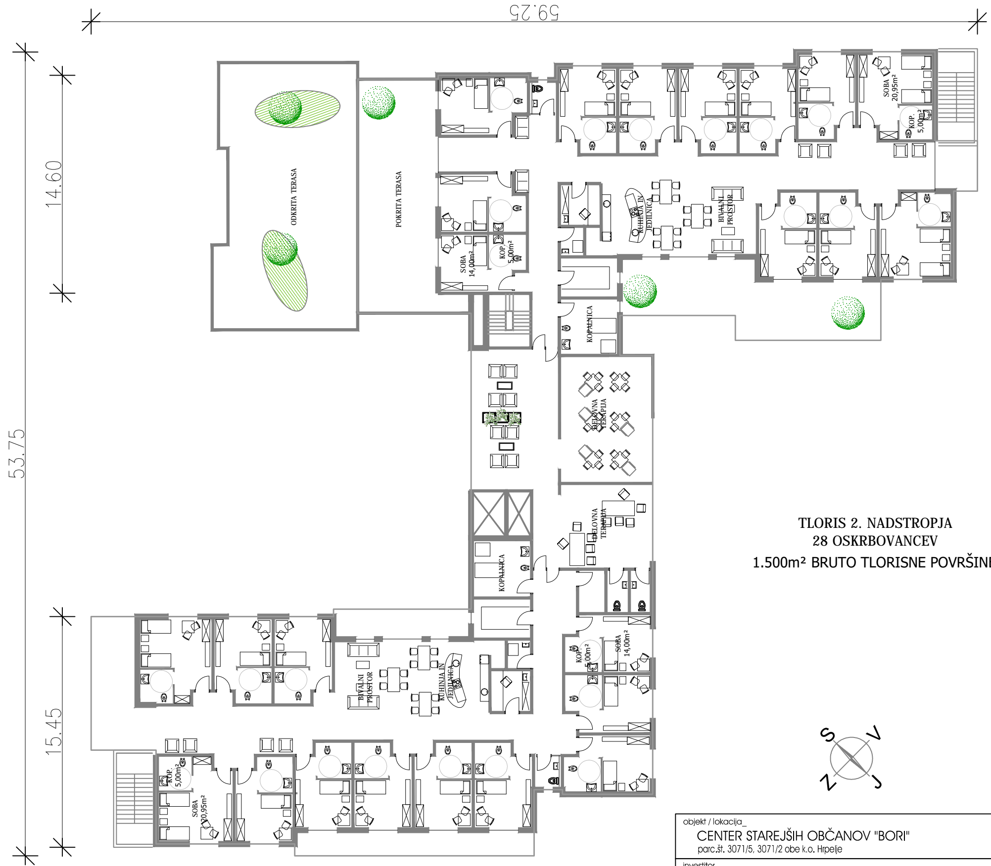
TLORIS 2. NADSTROPJA 28 OSKRBOVANCEV 1.500m 2 BRUTO TLORISNE POVRŠINE