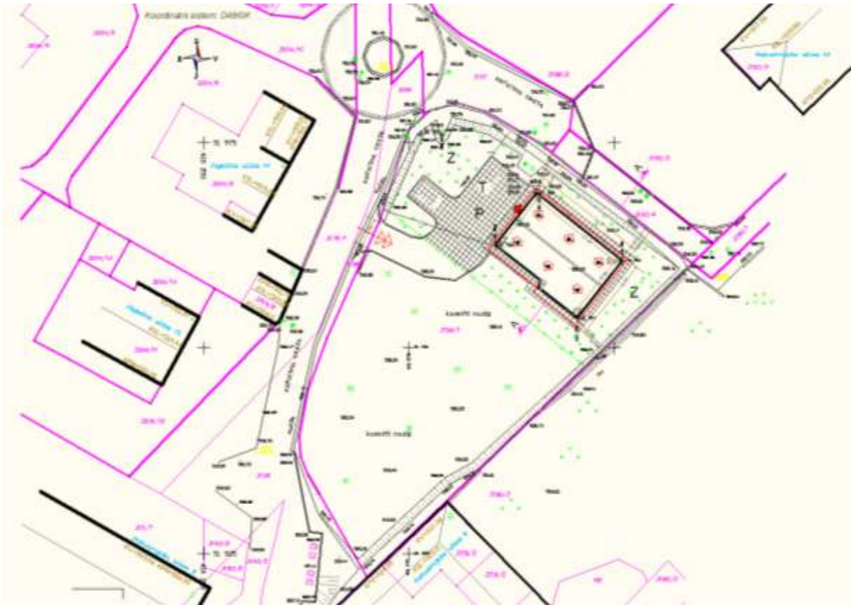
Slika 4: Prikaz umestitve objekta na zemljišče

Parkirišče za osebna vozila z ustreznim obračališčem je urejeno na dvorišču severozahodno od objekta na nivoju pritličja, predvideni sta 2 parkirni mesti.