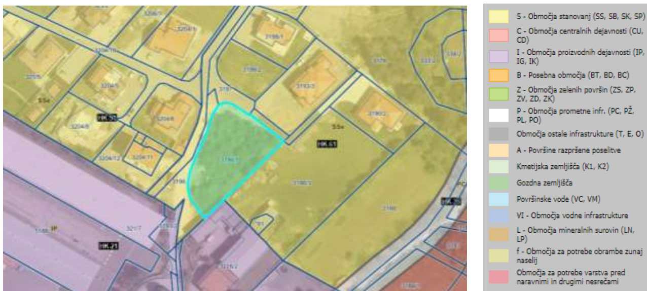
Slika 3: Prikaz obravnavanega zemljišča na prikazu namenske rabe iz OPN

Navedena odstopanja so skladna z osnovno namero prostorske izvedbene regulacije, saj ne spreminjajo namenske rabe prostora. Individualna odstopanja na obravnavanem zemljišču predstavljajo korektiv oziroma dopolnitev izvedbenega prostorskega akta. Izdelavo OPPN za namen gradnje enostanovanjske hiše se smatra kot neracionalno, zato se individualno odstopanje omogoča z lokacijsko preveritvijo.