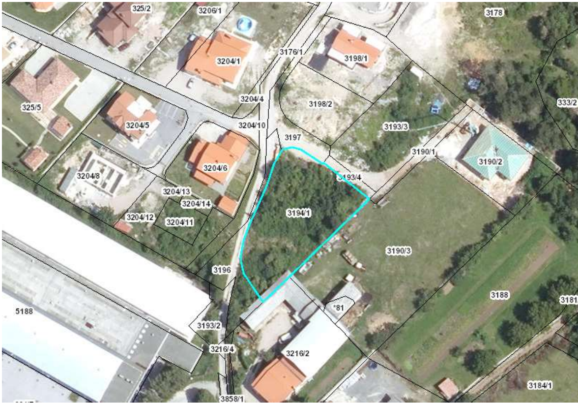
Slika 2: Prikaz parcelnega stanja na obravnavanem območju z označeno obravnavano zemljiško parcelo