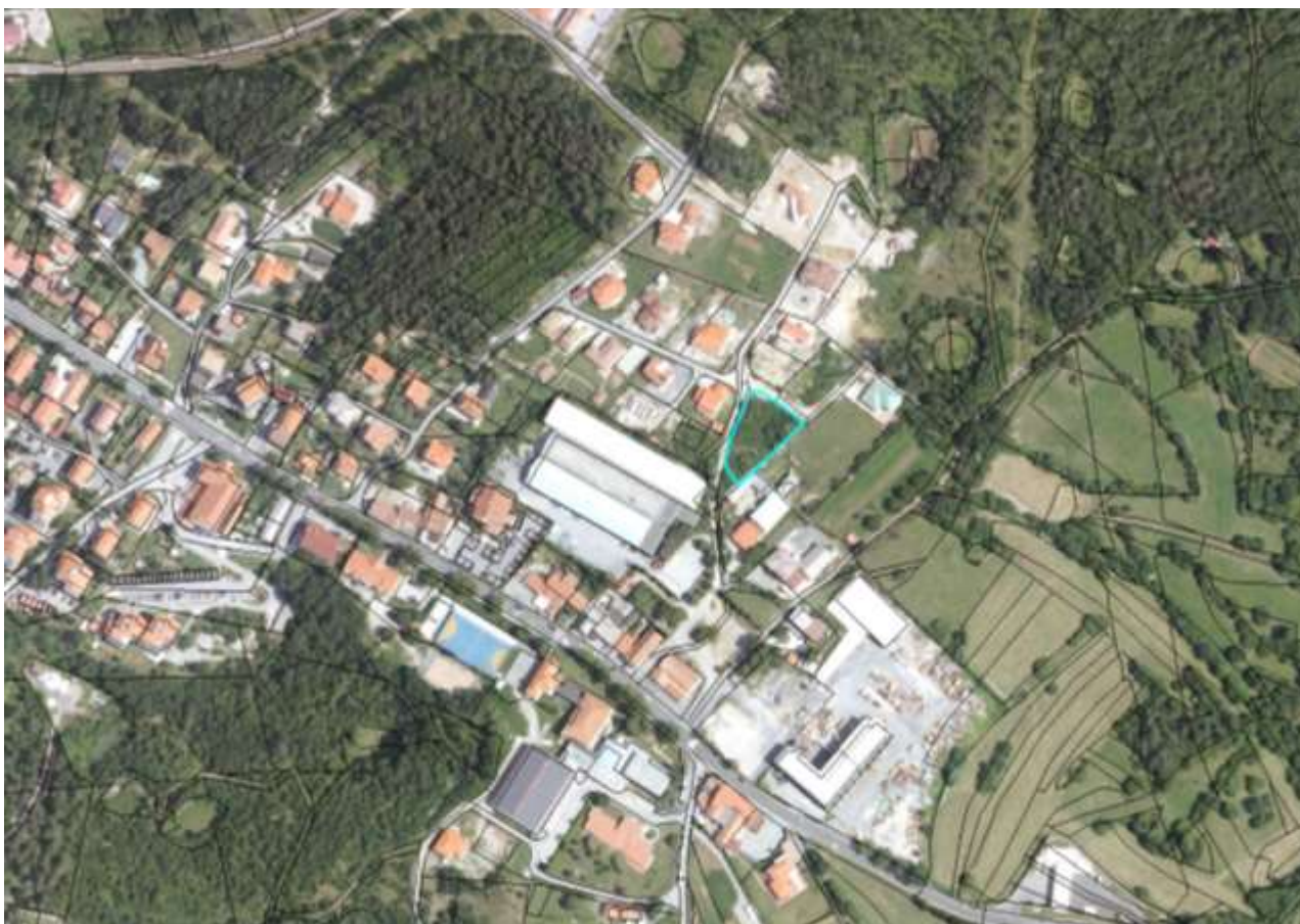
Slika 1: Prikaz širšega območja lokacijske preveritve z označeno obravnavano zemljiško parcelo

Nameravana gradnja izpolnjuje pogoje za izvedbo lokacijske preveritve, s katero se preveri ustreznost individualne namere za poseg v prostor in omogoči aktivacijo zemljišča. Zato je, skladno s prvim in drugim odstavkom 131. člena Zakona o urejanju prostora, Uradni list RS, št. 61/2017 (v nadaljevanju ZUreP-2) izdelan elaborat lokacijske preveritve.